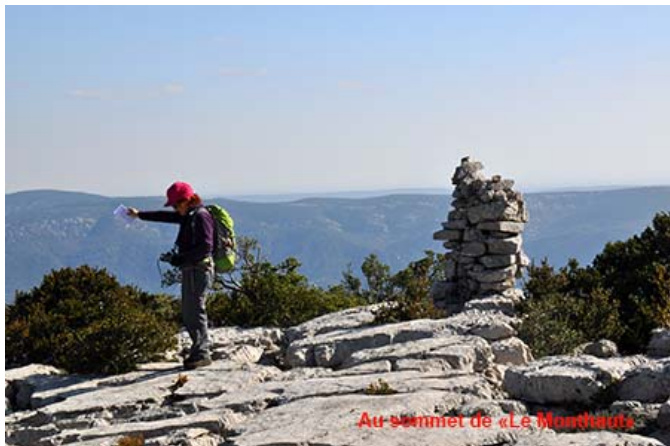
Au sommet de «Le Monthaut»